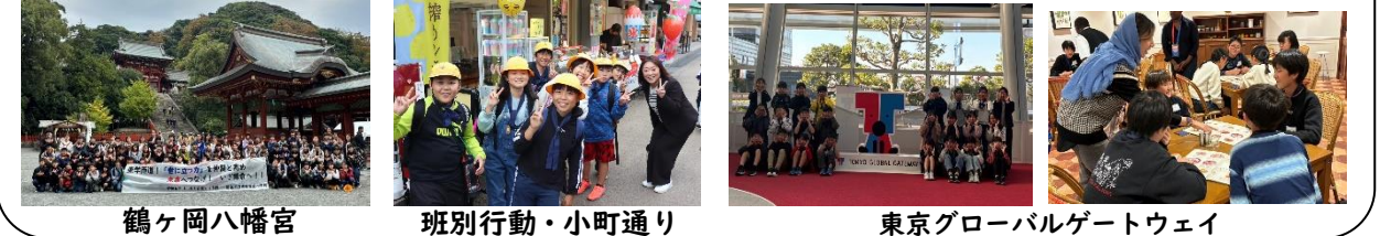
鶴ヶ岡八幡宮 班別行動・小町通り 東京グローバルゲートウェイ